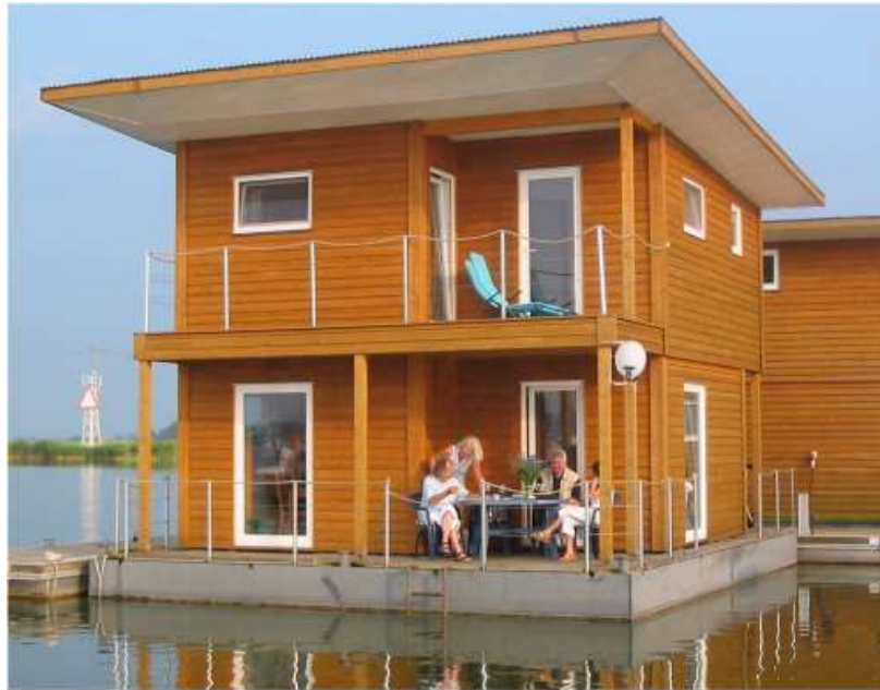
FLOATING HOUSE in Kröslin

Die FLOATING HOUSES bieten ein einmaliges Wohnerlebnis: